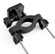
ROHRHALTERUNG 36 BIS 63 MM