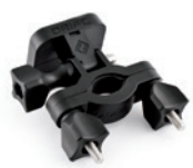
ROHRHALTERUNG 19 BIS 36 MM