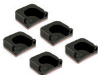
KLEBEFLÄCHEN GEBOGEN 5ER