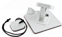
SURFHALTERUNG FSC FINNENSYSTEM