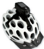
HALTERUNG FÜR BELÜFTETE HELME