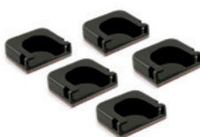
KLEBEFLÄCHEN GERADE 5ER